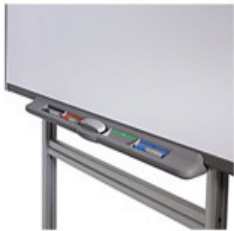
Nuovo sistema di blocco del supporto da pavimento