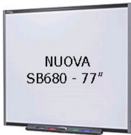
Nuove penne ergonomiche e cancellino